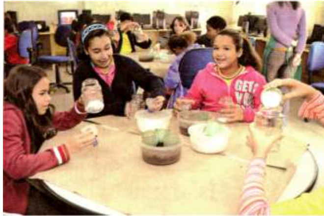
AO LONGO DESTA SEMANA, O Instituto Recicle está visitando cinco Centros de Educação Municipais oferecendo oficinas culturais que utilizam um território como ferramenta de observação

OBJETIVO Crianças em sala de aula aprendem na prática sobre o ciclo da água. O objetivo da atividade é ensinar as crianças sobre o ciclo da água e a importância da água para a vida. A atividade é realizada em uma sala de aula e envolve a participação de todas as crianças. O professor explica o ciclo da água e as crianças fazem um experimento para observar o ciclo da água na prática. O experimento consiste em colocar água em um recipiente e deixar ao sol. As crianças observam a água evaporar e formar nuvens. O professor explica que a água evapora e se transforma em vapor d'água. O vapor d'água se condensa e forma nuvens. As nuvens se movem pelo vento e caem na forma de chuva. A chuva cai no chão e some para sempre. O professor explica que a água não some para sempre, ela só muda de estado. A água pode ser líquida, sólida ou gasosa. A água líquida é a água que vemos todos os dias. A água sólida é o gelo. A água gasosa é o vapor d'água. O professor explica que a água é essencial para a vida. Sem água, não há vida. A água é um recurso precioso e devemos cuidar dela. O professor explica que a água é reciclada. A água que cai no chão some para sempre, mas ela não desaparece. Ela só muda de estado. A água que cai no chão some para sempre, mas ela não desaparece. Ela só muda de estado.