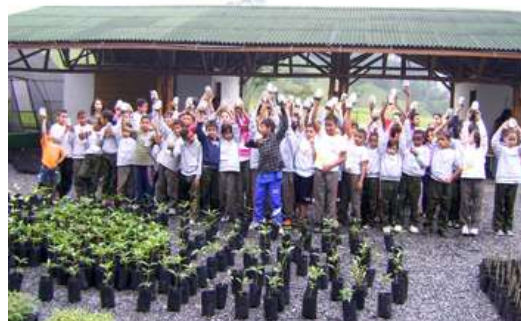
Oficina de terrário na Ecovias